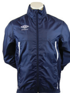
Marine / Blanc 401