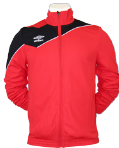
Rouge / Noir / Blanc 904