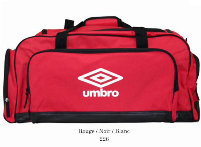
Rouge / Noir / Blanc 226