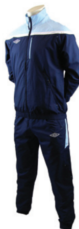
Marine / Ciel / Blanc 430