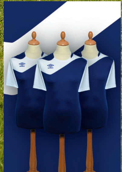
Division 1 18