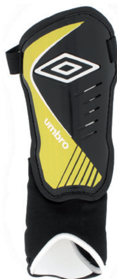
Noir / Jaune / Blanc DPH