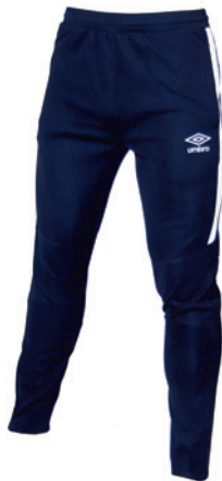
Marine / Blanc 401