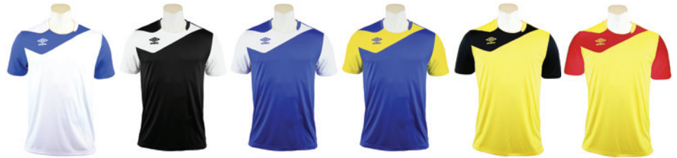
Blanc / Royal 105