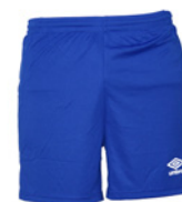
Royal / Blanc 511