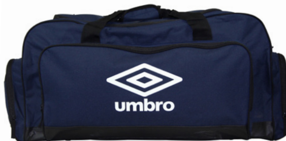
Marine / Blanc N84