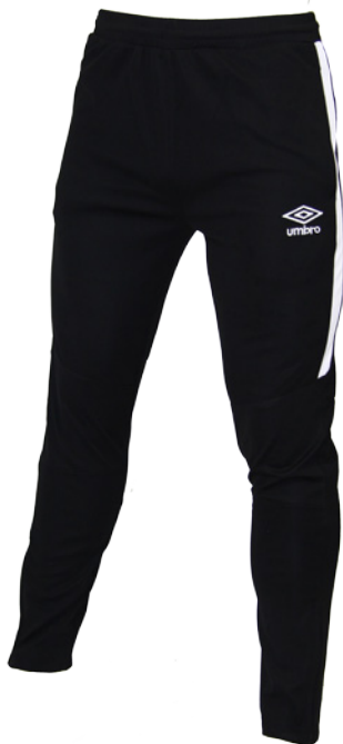
Noir / Blanc 203