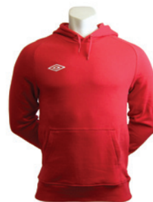
Rouge / Blanc 901