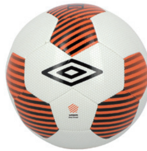
Blanc / Orange fluo / Noir DL6 ( Taille 5 )