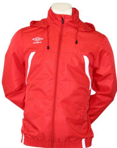
Rouge / Blanc 901