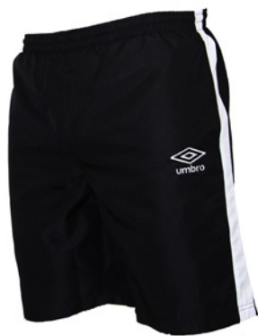
Noir / Blanc 203