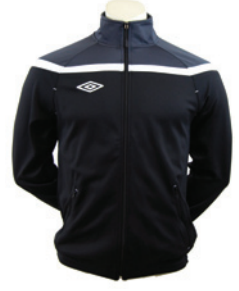
Noir / Gunmetal / Blanc 237