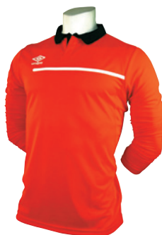
Orange fluo / Noir / Blanc 665