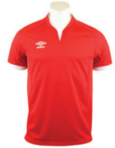
Rouge / Blanc 901