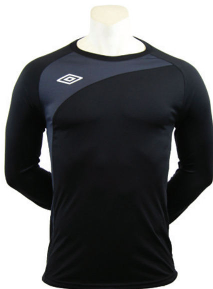
Noir / Gunmetal 235