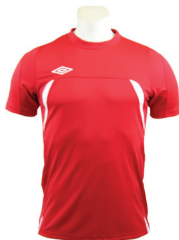
Rouge / Blanc 901