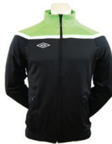
Noir / Vert fluo / Blanc 259