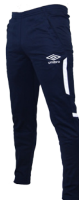
Marine / Blanc 401