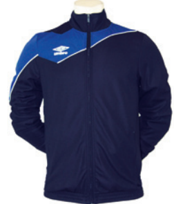
Marine / Royal 426