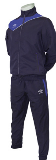
Marine / Royal 426