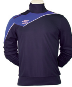
Marine / Royal 426