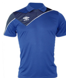
Royal / Marine / Blanc 514