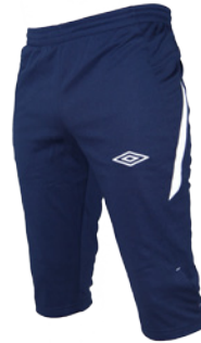
Marine / Blanc 401