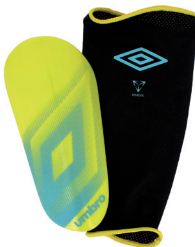
Jaune / Turquoise DL J