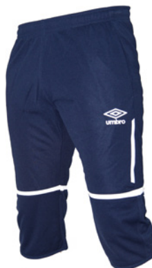
Marine / Blanc 401