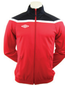
Rouge / Noir / Blanc 904