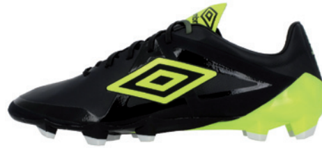
Noir / Jaune fluo / Blanc DKB