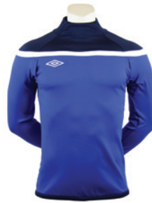
Royal / Marine / Blanc 514