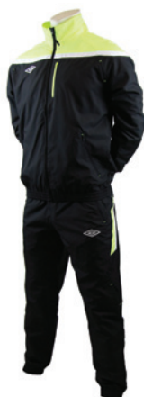
Noir / Jaune fluo / Blanc 251