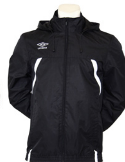
Noir / Blanc 203