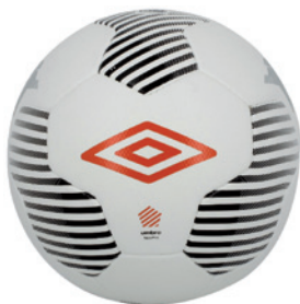
Blanc / Noir / Orange fluo DDS