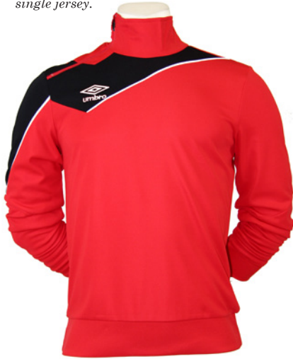
Rouge / Noir / Blanc 904