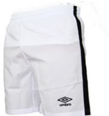
Blanc / Noir 103