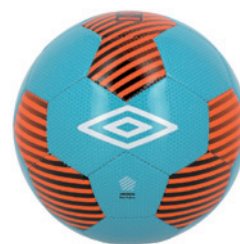
Bleu scaphandre / Orange fluo / Noir / Blanc DL8 ( Taille 3 )