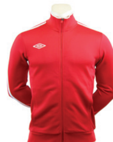
Rouge / Blanc 901