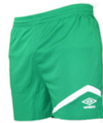
Vert / Blanc 701