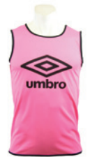
Rose fluo / Noir 952