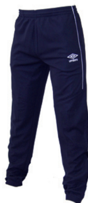
Marine / Blanc 401