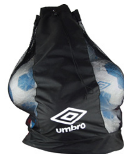
Noir / Blanc 090