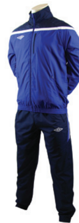
Royal / Marine / Blanc 514