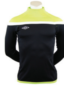
Noir / Jaune fluo / Blanc 251