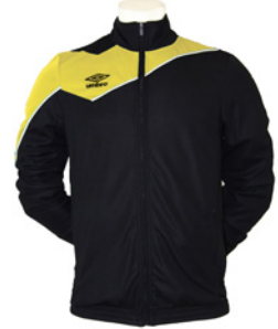
Noir / Jaune 209