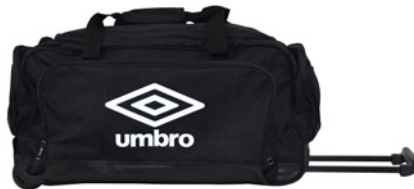
Noir / Blanc 090