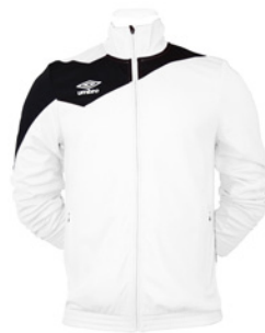
Blanc / Noir 103