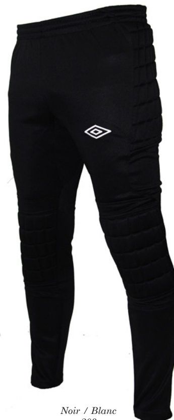
Noir / Blanc 203