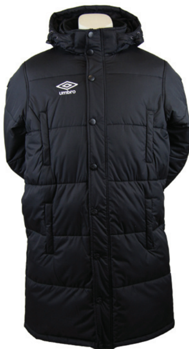
Noir / Blanc 203