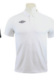
Blanc / Noir 103