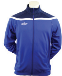
Royal / Marine / Blanc 514