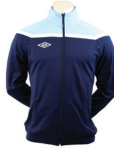
Marine / Ciel / Blanc 430