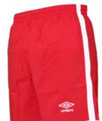
Rouge / Blanc 901