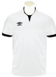
Blanc / Noir 103