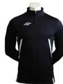
Noir / Blanc 203