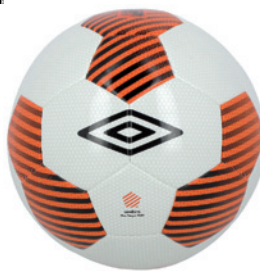
Blanc / Orange fluo / Noir DL6