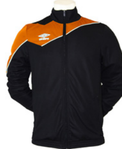
Noir / Orange fluo 254