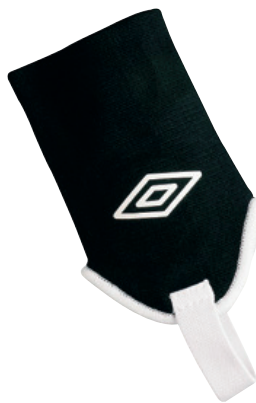
090 Noir / Blanc