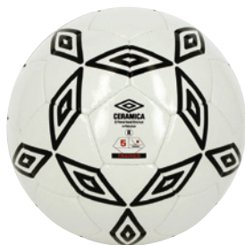
Blanc / Noir H88