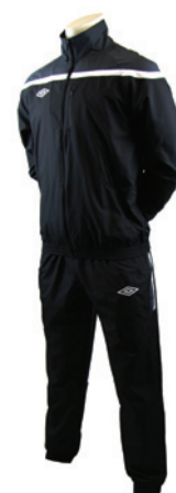
Noir / Gunmetal / Blanc 237