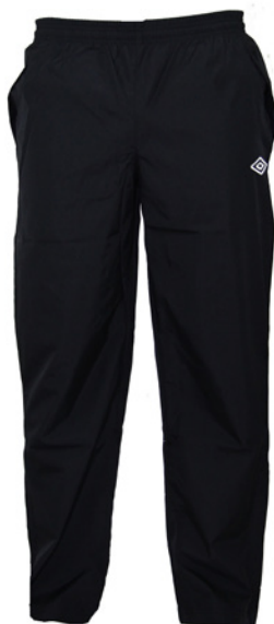
Noir / Blanc 090