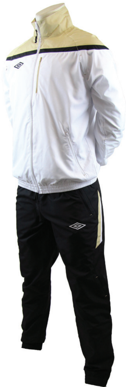
Blanc / Or / Noir 123