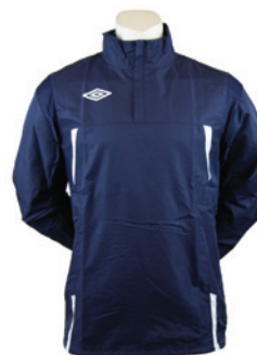
Marine / Blanc 401