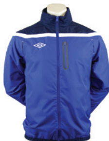
Royal / Marine / Blanc 514