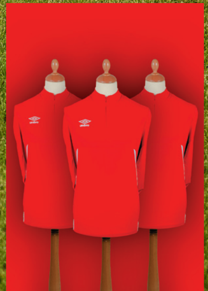
Gamme Pro training 38