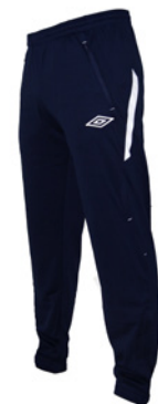
Marine / Blanc 401