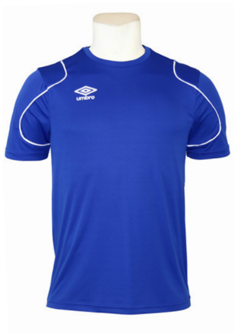
Royal / Blanc 511