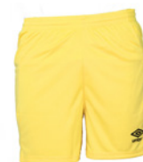
Jaune / Noir 601