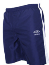
Marine / Blanc 401