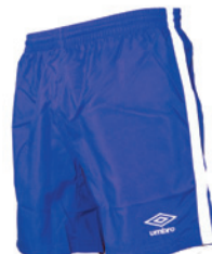
Royal / Blanc 511