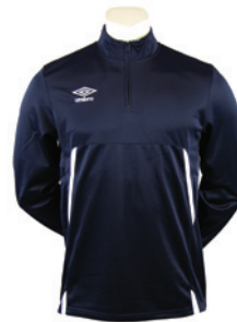
Marine / Blanc 401