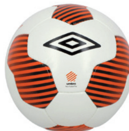
Blanc / Orange fluo / Noir DL6