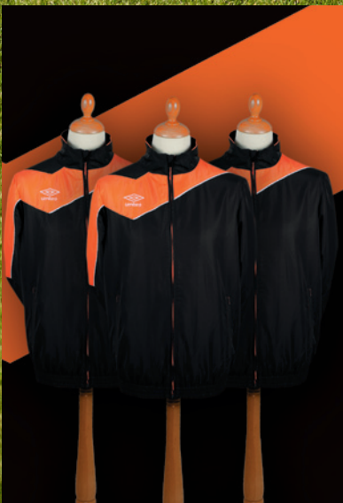
Gamme Division 1 27