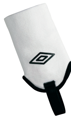
096 Blanc / Noir