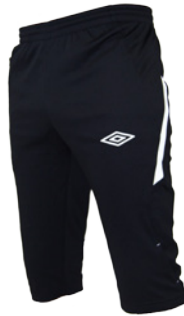
Noir / Blanc 203