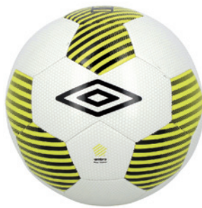
Blanc / Jaune fluo / Noir DWM ( Taille 5 )