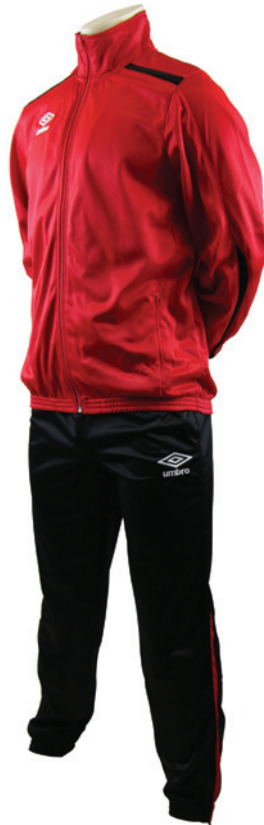
Rouge / Noir / Blanc 904