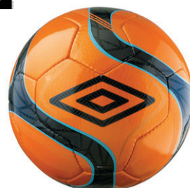
Orange / Noir BT1