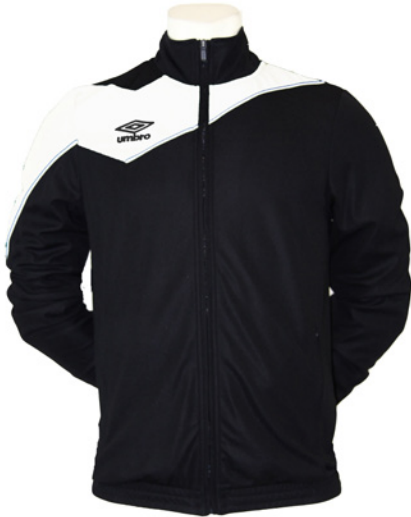
Noir / Blanc 203