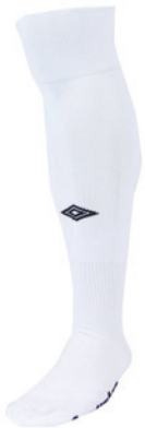
Blanc / Noir 096