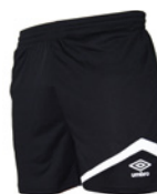
Noir / Blanc 203