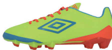
Jaune fluo / Bleu scaphandre / Corail DKC