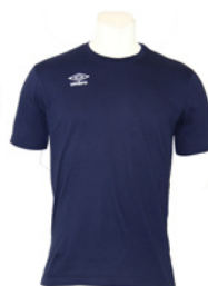
Marine / Blanc 401