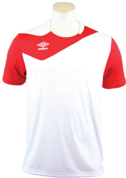
Blanc / Rouge 104