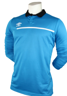
Bleu électrique / Noir / Blanc 555