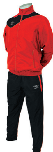
Rouge / Noir / Blanc 904