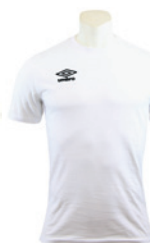
Blanc / Noir 103