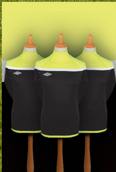
Gamme Nation 33