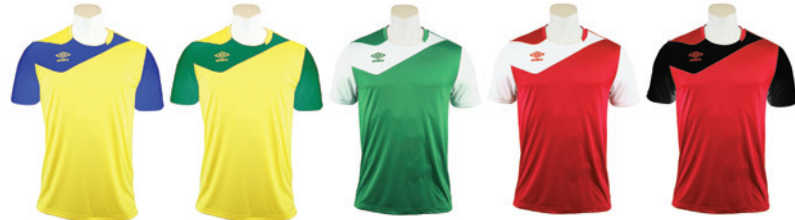
Jaune / Royal 603