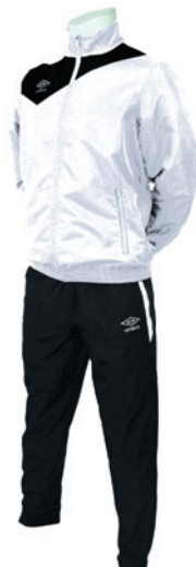
Blanc / Noir 103