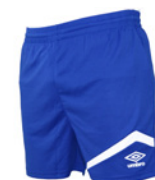
Royal / Blanc 511