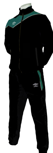
Noir / Vert 211