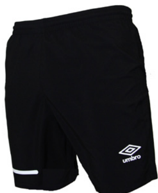
Noir / Blanc 203