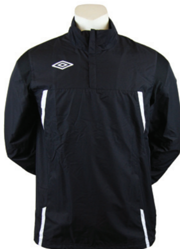
Noir / Blanc 203