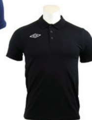
Noir / Blanc 203