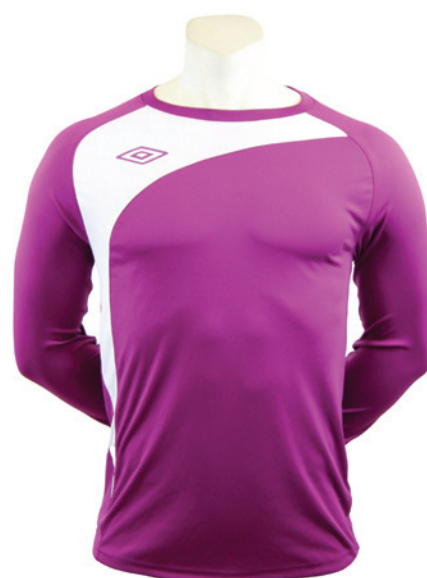
Violet électrique / Blanc 522