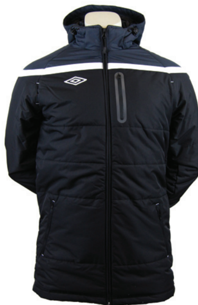
Noir / Gunmetal / Blanc 237