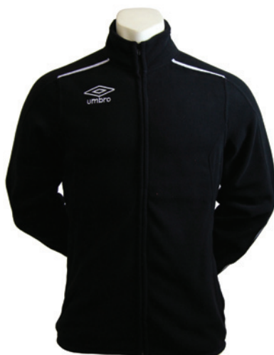
Noir / Blanc 203