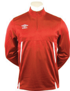
Rouge / Blanc 901