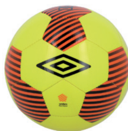
Jaune fluo / Orange fluo / Noir DL7 ( Taille 4 )