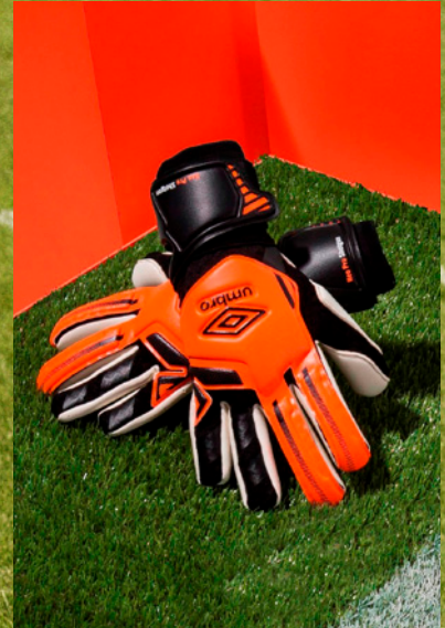
Protèges tibias & Gants 11 & 12