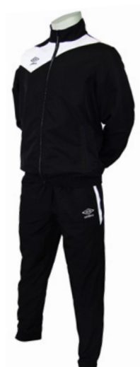
Noir / Blanc 203