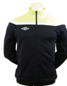
Noir / Jaune fluo / Blanc 251