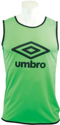
Vert fluo / Noir 753