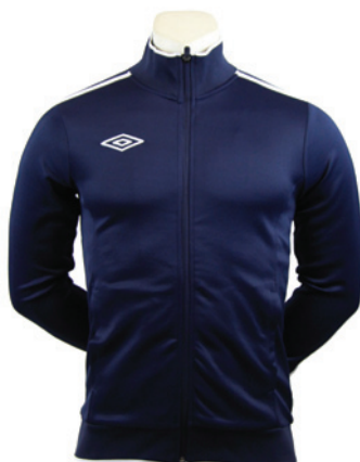
Marine / Blanc 401