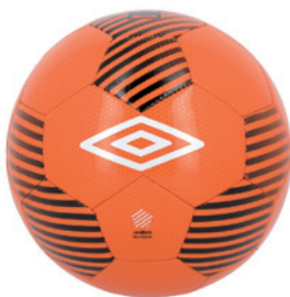
Orange fluo / Noir / Blanc DKD ( Taille 4 )