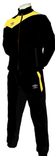
Noir / Jaune 209