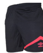
Noir / Rouge 206