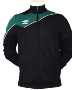
Noir / Vert 211