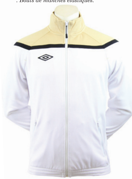
Blanc / Or / Noir 123