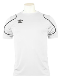
Blanc / Noir 103