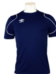
Marine / Blanc 401