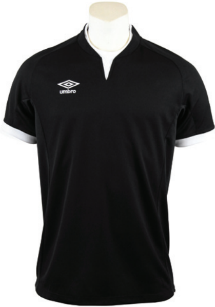
Noir / Blanc 203

. Inserts en mesh pour une meilleure ventilation. . Col contemporain.