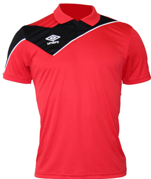
Rouge / Noir / Blanc 904