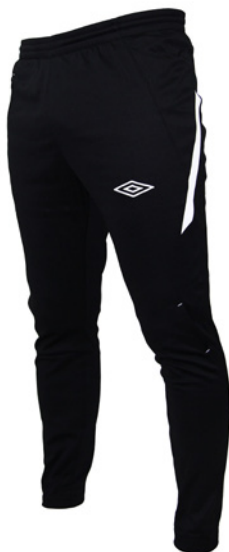
Noir / Blanc 203