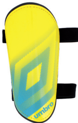
Jaune / Turquoise DLJ