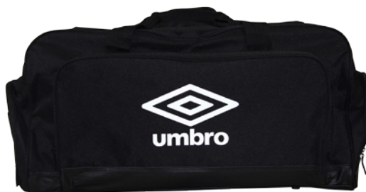
Noir / Blanc 090