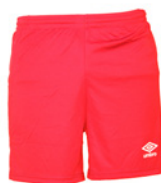
Rouge / Blanc 901