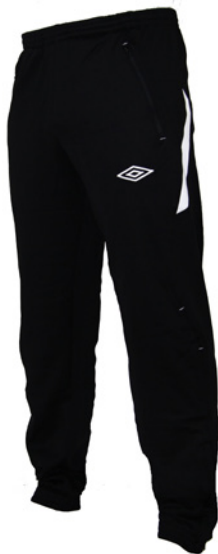
Noir / Blanc 203