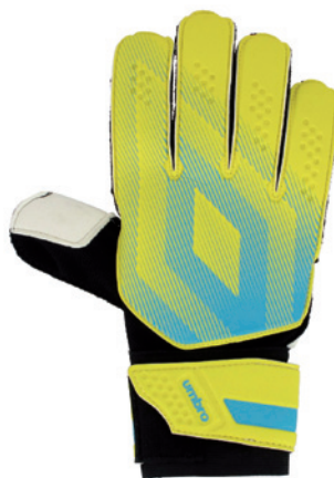
Jaune / Turquoise / Noir DLK