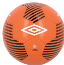
Orange fluo / Noir / Blanc DKD