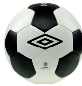
Blanc / Noir / Rouge 2VZ