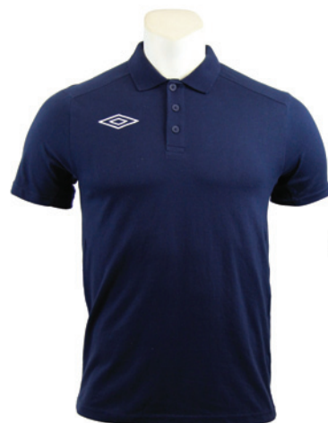
Marine / Blanc 401