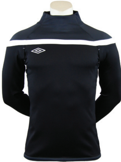
Noir / Gunmetal / Blanc 237