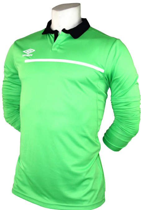
Vert fluo / Noir / Blanc 753