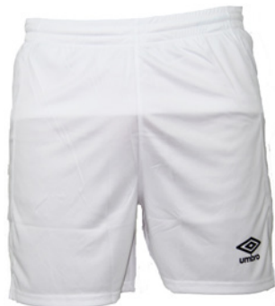
Blanc / Noir 103