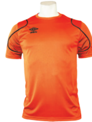
Orange fluo / Noir 664