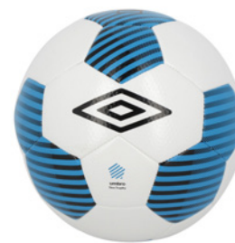
Blanc / Bleu atoll / Noir DHC