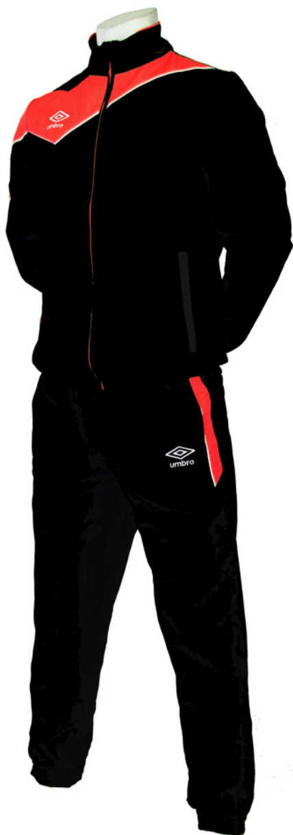
Noir / Orange fluo 254