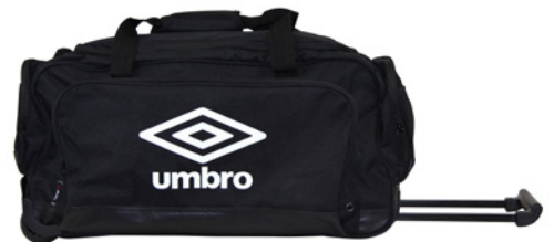
Noir / Blanc 090