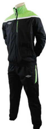
Noir / Vert fluo / Blanc 259