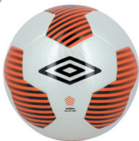
Blanc / Orange fluo / Noir DL6