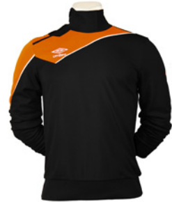
Noir / Orange fluo 254