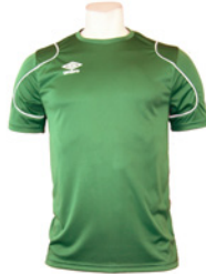
Vert / Blanc 701