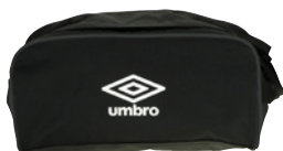
Noir / Blanc 090