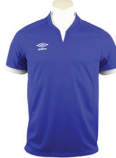
Royal / Blanc 511