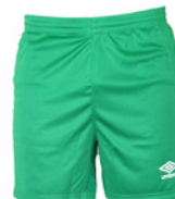
Vert / Blanc 701