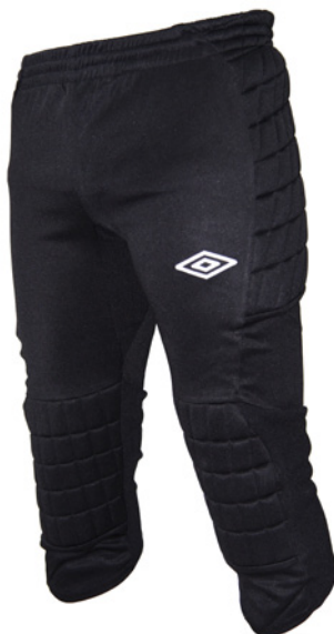
Noir / Blanc 203