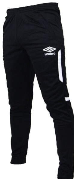
Noir / Blanc 203