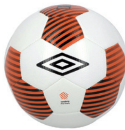
Blanc / Orange fluo / Noir DL6