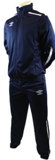
Marine / Blanc 401