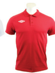
Rouge / Blanc 901