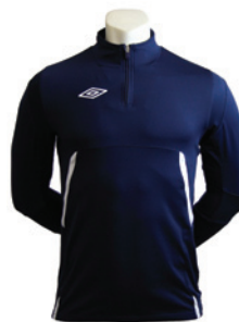
Marine / Blanc 401