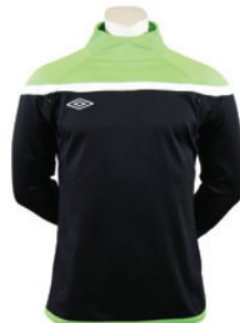
Noir / Vert fluo / Blanc 259