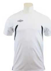
Blanc / Noir 103