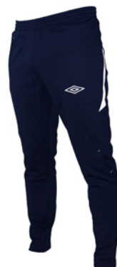
Marine / Blanc 401