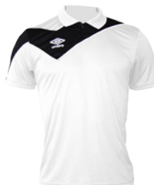
Blanc / Noir 103