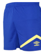
Royal / Jaune 513