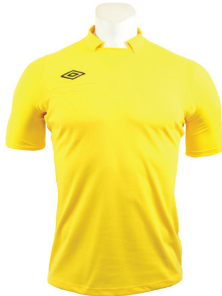
Jaune / Noir 0LF