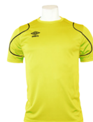
Jaune fluo / Noir 651