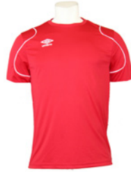
Rouge / Blanc 901