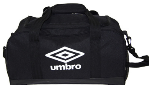
Noir / Blanc 090