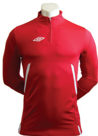
Rouge / Blanc 901