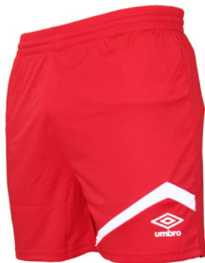
Rouge / Blanc 901