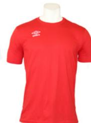
Rouge / Blanc 901