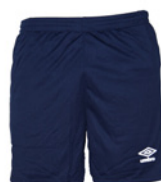
Marine / Blanc 401