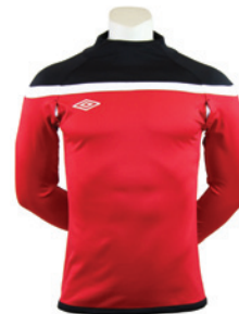
Rouge / Noir / Blanc 904