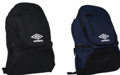
Noir / Blanc 090