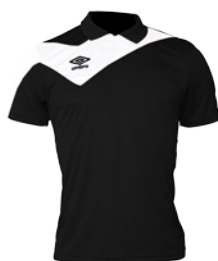
Noir / Blanc 203