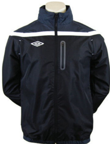
Noir / Gunmetal / Blanc 237