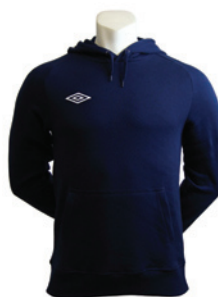
Marine / Blanc 401