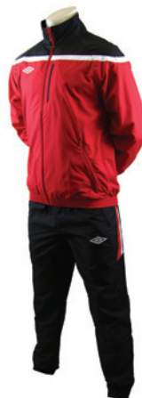
Rouge / Noir / Blanc 904