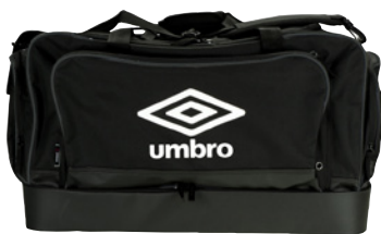
Noir / Blanc 090